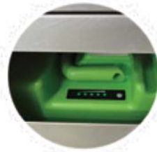
電池容量の検査ウインドウ付き