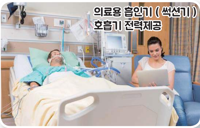
의료용 흡인기 (씩션기) 호흡기 전력제공