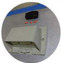
방발수 콘센트 커버