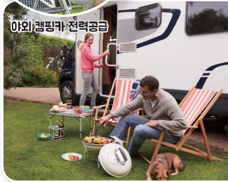
야외 캠핑카 전력공급