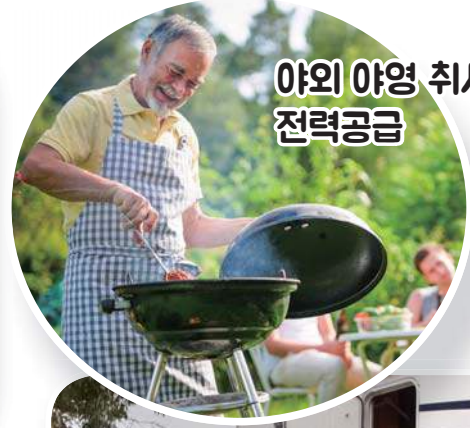
야외 야영 취사시 전력공급