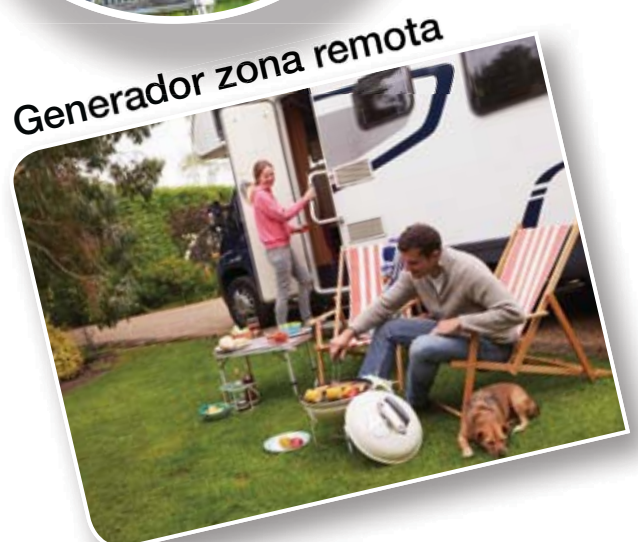
Generador zona remota