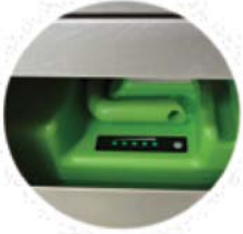
Ventana de capacidad