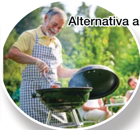
Alternativa aire libre