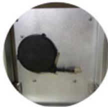
Bandeja guarda cable