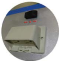
Cobertura de enchufe